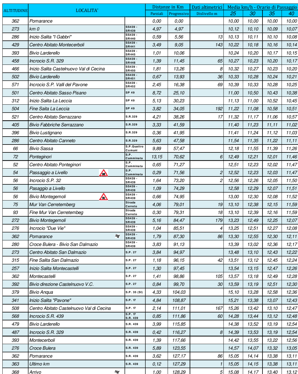
Tabella Cronometrica Tableau de Marche Percorso Granfondo